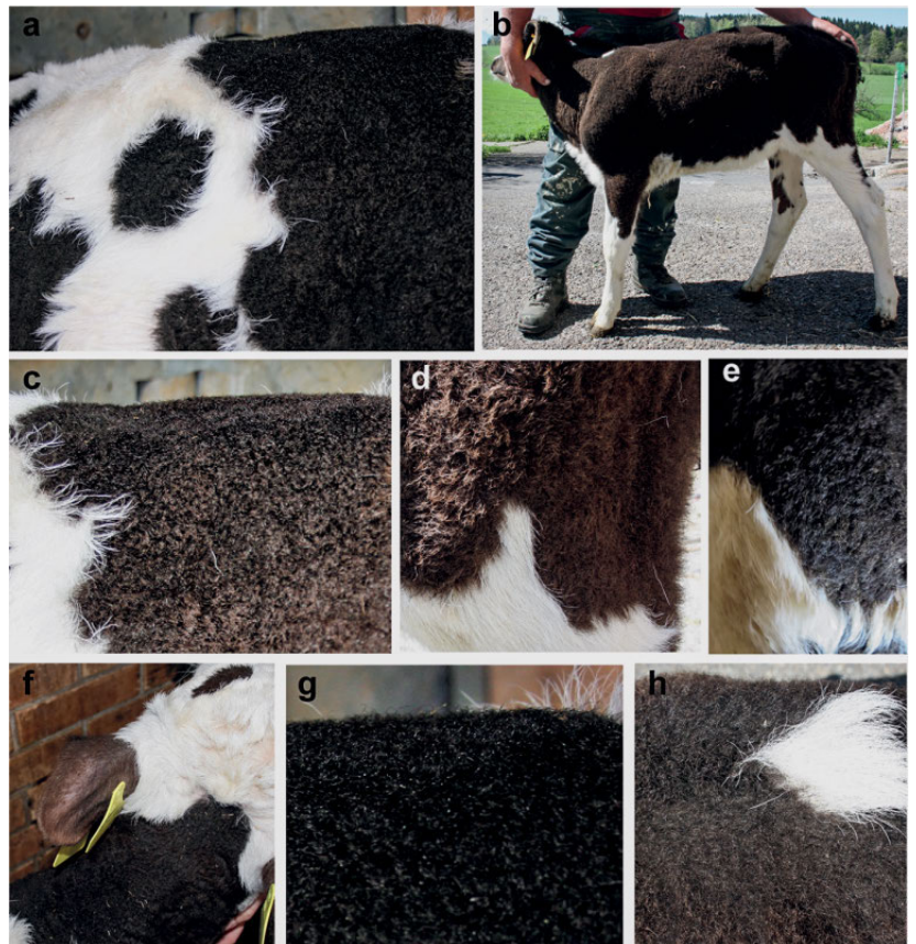
Abb. 3: Beispiele für das krause und verkürzte Haar im pigmentierten Bereich des Fells bei Kälbern. (a-h) Das weisse Haar ist normal. Die pigmentierten Haare sind aufgeheilt und zum Teil rötlich. (f) Eine Hypotrichose an den Ohren ist oftmals bereits früh ausgeprägt.

Die Isolierung von genomischer DNA aus Haarwurzelnproben oder Blut wurde mit dem Maxwell Kit (Promega, Dübendorf) gemäss Anleitung durchgeführt. Die Sequenzanalysen der beiden Varianten im MC1R Gen (NM_174108.2: c.296T>C; p.Leu99Pro (dominant schwarz) und c.311delG; p.Gly104fs (rezessiv rot)) und der Variante im PMEL Gen (NM_001080215.2: c.54_56delTCT; p.Leu19del) wurden mittels PCR und anschliessender direkter Sequenzierung auf dem 3730 DNA-Analyser (ThermoFisher, Reinach) durchgeführt. Dabei konnte gezeigt werden, dass alle hier präsentierten 33 Fälle jeweils eine Kopie der untersuchten Varianten aufwiesen. Einerseits waren alle Tiere heterozygot für die dominant vererbte schwarze Fellfarbe verursachende Variante im MC1R Gen sowie Träger einer Kopie der rezessiv vererbten Rotfaktorvariante. Andererseits waren alle Fälle heterozygote Anlageträger für die Variante im PMEL Gen, die mit einer semidominant vererbten Form der Farbverdünnung (falb) bei verschiedenen Rassen