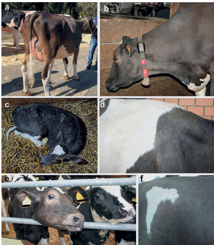
Abb. 2: Beispiele für die aufgehellte Fellfarbe bei Holsteinrindern. (a) Deutliche Farbaufhellung im Vergleich zur schwarzen Holsteinkuh im Hintergrund. (b) Aufgehellte Fellfarbe sowie schütterere Behaarung im Kopfbereich. (c) Betroffenes frisch geborenes Kalb, welches schon eine Farbverdünnung zeigt. (d) Grau-rötlich erscheinendes kurzes Fell, das weiße Haar ist normal. (e) Kopf eines betroffenen Kalbes mit Farbaufhellung und Hypotrichose im Vergleich zu einem normalen Kalb rechts. (f) Aufgehelltes schwarzes Fell, das weiße Haar ist normal.

Von den 33 schwarz-weiss gescheckten Tieren waren 4 Rinder männlich und 29 Rinder weiblich. Dieser deutliche Unterschied beruht wahrscheinlich darauf, dass vor allem die weiblichen Rinder für die Nachzucht aufgezogen werden und die Stierkälber vorher geschlachtet werden. Insgesamt wurden 12 Kälber, sowie 6 Jungrinder und 15 laktierende Kühe unterschiedlichen Alters untersucht. Neben einem Kreuzungstier (Limousin × Holstein) waren die übrigen 32 Tiere im Herdebuch den