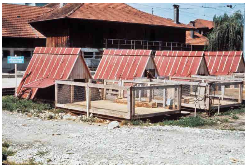
Abbildung 1: Das „Riemser-Hütten“ oder „schwedische Sanierungsverfahren“.

1 Mitarbeiter und Geschäftsführer beim SGD von 1972–2001