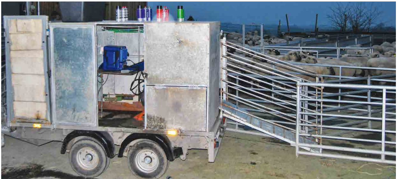
Abbildung 2: Untersuchungswagen mit Treibgang, wie er für die Herden A, B, C, E und G zum Einsatz kam.