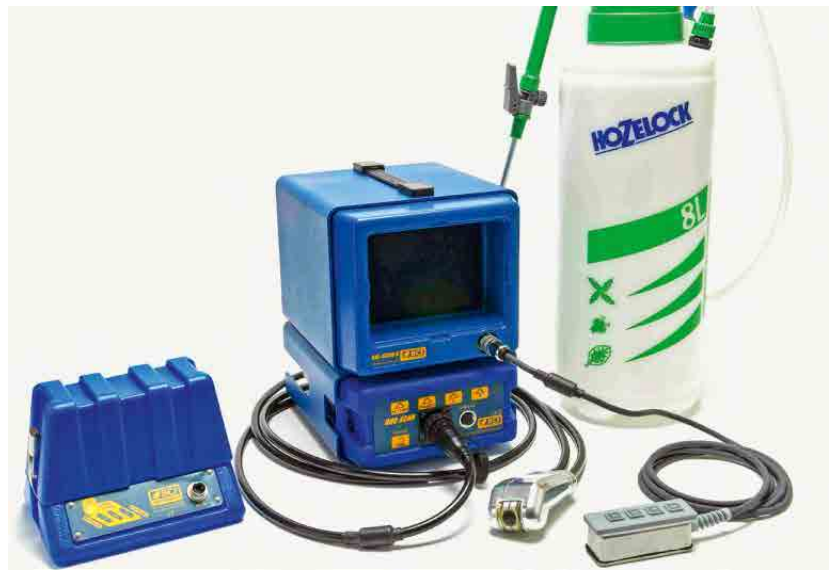
Abbildung 1: Ovi-Scan™ mit einer mechanischen sektoriellen 170° 3.5 MHz Sonde und Druckbehälter (BCF Technology Ltd., Bellshill, Grossbritannien).

Alle Trächtigkeitsuntersuchungen fanden zwischen dem 12. und 14. November 2013 im Raum Ostschweiz und im Kanton Luzern statt und wurden von einer erfahrenen Untersucherin vorgenommen. Für die Untersuchungen wurde ein Ovi-Scan™ Ultraschallgerät mit einer mechanischen sektoriellen 170° 3.5 MHz Sonde verwendet (BCF Technology Ltd., Bellshill, Grossbritannien) (Abb. 1). Ovi-Scan™ wurde speziell für den Einsatz in